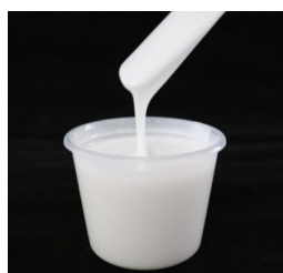
無配合のシーリング材