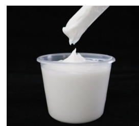
当社製品配合のシーリング材