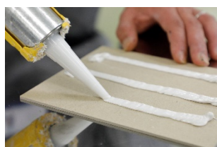
シーリング材試験の様子