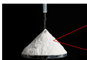
軽質炭酸カルシウム

今回、当社の「シーリング材・接着剤業界向け炭酸カルシウム」がグローバルニッチトップとなっている製品として高く評価され、認定に至りました。当社製品は、建築用の接着剤、自動車用のシーリング材に対して、粘度や機械物性をコントロールするフィラーでシーリング材・接着剤業界における、適正コストでの粘度調整機能のニーズに応えるものとなっております。当社の強みは、粒子径 20 nm から 150 nm に任意にかつ均一に制御した粒子の表面を、用途に応じて脂肪酸や樹脂酸などを均一に表面被覆する技術にあり、脂肪酸被覆品であれば、粒子表面に脂肪酸を完全に一層で覆うことが可能なところです。世界シェアは21%を持ち、販売国数は19か国に上ります。